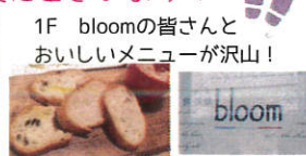
1F bloomの皆さんとおいしいメニューが沢山！