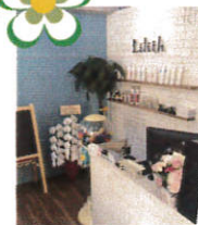
↑3F美容室Lilithさんお洒落な内装です♪