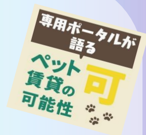
SUUMO掲載物件のうち、ペット相談可能物件の割合推移

大手ポータルサイトでは、ペット飼育可能物件の掲載件数が5年で倍増。 供給数が増えているものの、入居者への意識調査では 「 ペットを飼いたい 」という声が5割を超え、まだ需要が見込めます！